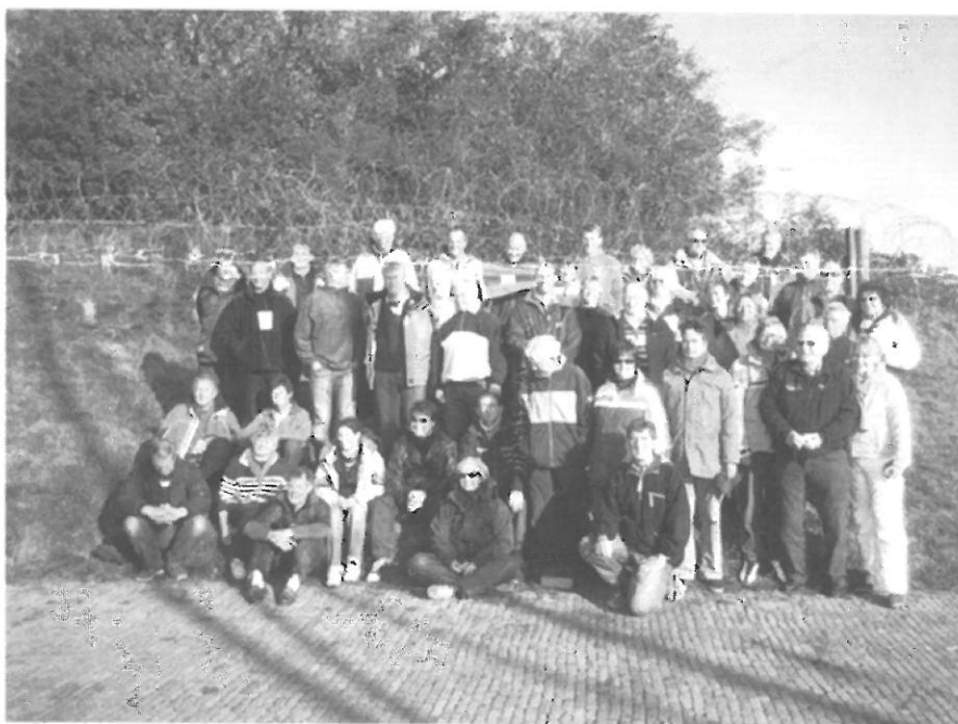
Deelnemers aan de lustrumtocht in oktober 2007